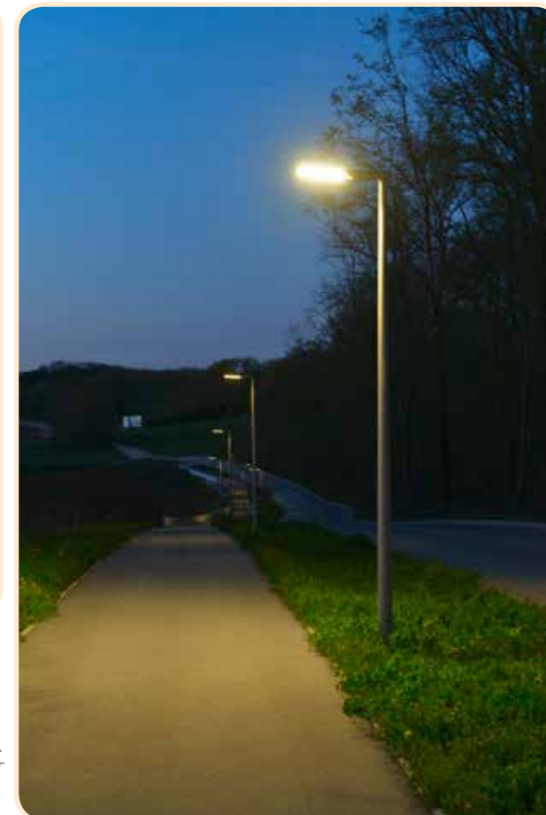
Rénovation de l'éclairage public, voies modes doux, urbanisme durable... L'action des communes concourt à la transition énergétique