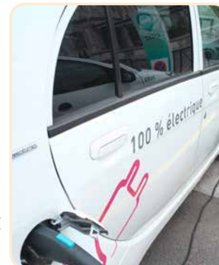
Véhicules électriques et autopartage permettent de rationaliser les flottes de véhicules des collectivités

La mise en place des mesures de réduction du besoin de déplacement professionnel de l'action 16 a des implications sur la gestion du parc de véhicules des collectivités. Par ailleurs, pour les véhicules en circulation, des mesures sont prises afin de réduire leur impact sur la qualité de l'air, dans un budget maîtrisé pour les collectivités. Il s'agit ici de convertir les véhicules vers des systèmes de carburation « propre » et économe prenant en compte les évolutions technologiques et de rationaliser la flotte existante en optimisant l'utilisation des véhicules.