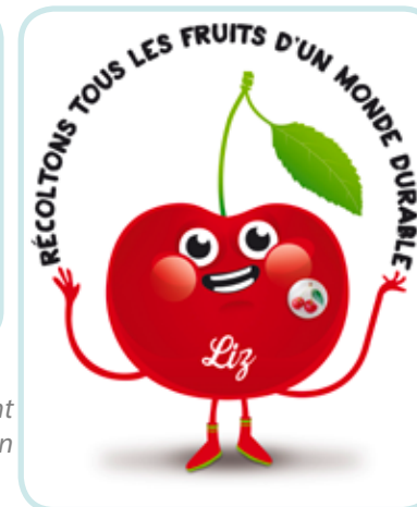
Liz La Cerise est la mascotte incarnant le développement durable à Besançon et au Grand Besançon