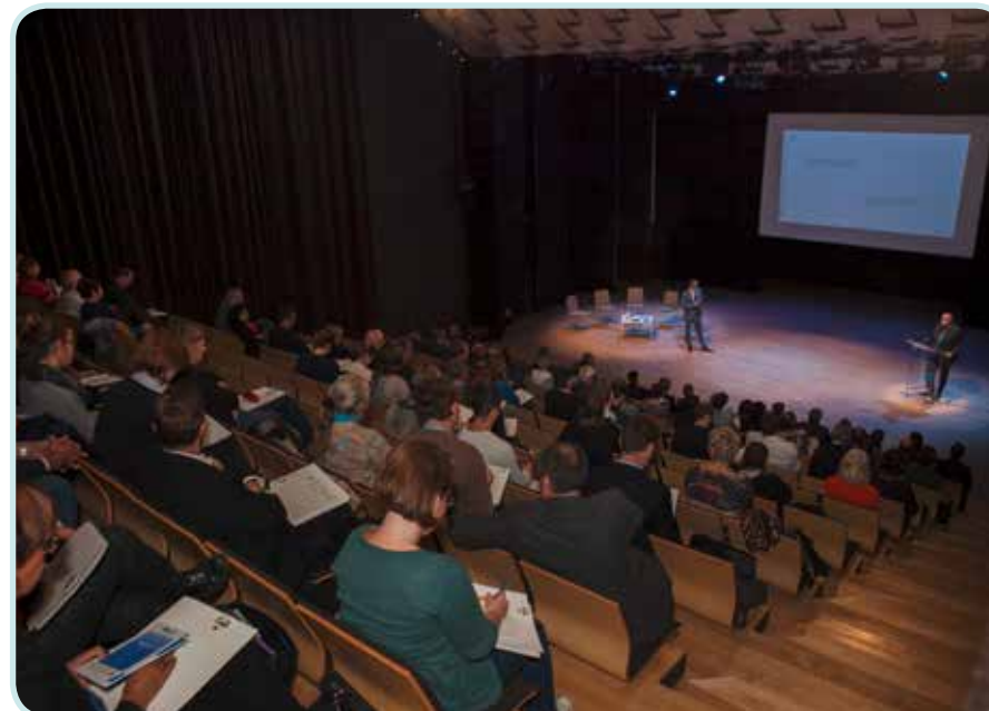
Les colloques de la transition énergétique sont organisés par le Grand Besançon et le club FACE

La coopération avec le tissu économique endogène permettra des gains de compétitivité pour les entreprises du territoire, tout en assurant la réalisation des objectifs du PCAET. Celle-ci passe par des actions de sensibilisation et d'information (colloques et matinales, site internet dédié, message véhiculé par les chargés d'affaires ou sur le site Invest'in...), un partenariat privilégié avec les entreprises s'engageant dans la signature de plan d'actions qu'elles portent, des outils d'accompagnement (plans de mobilité (PDE ou PDIE – Plan de Déplacement Entreprise ou Inter-Entreprises), plateforme régionale de l'innovation dans le bâtiment pouvant accueillir une antenne locale du Pôle Energie Franche-Comté).