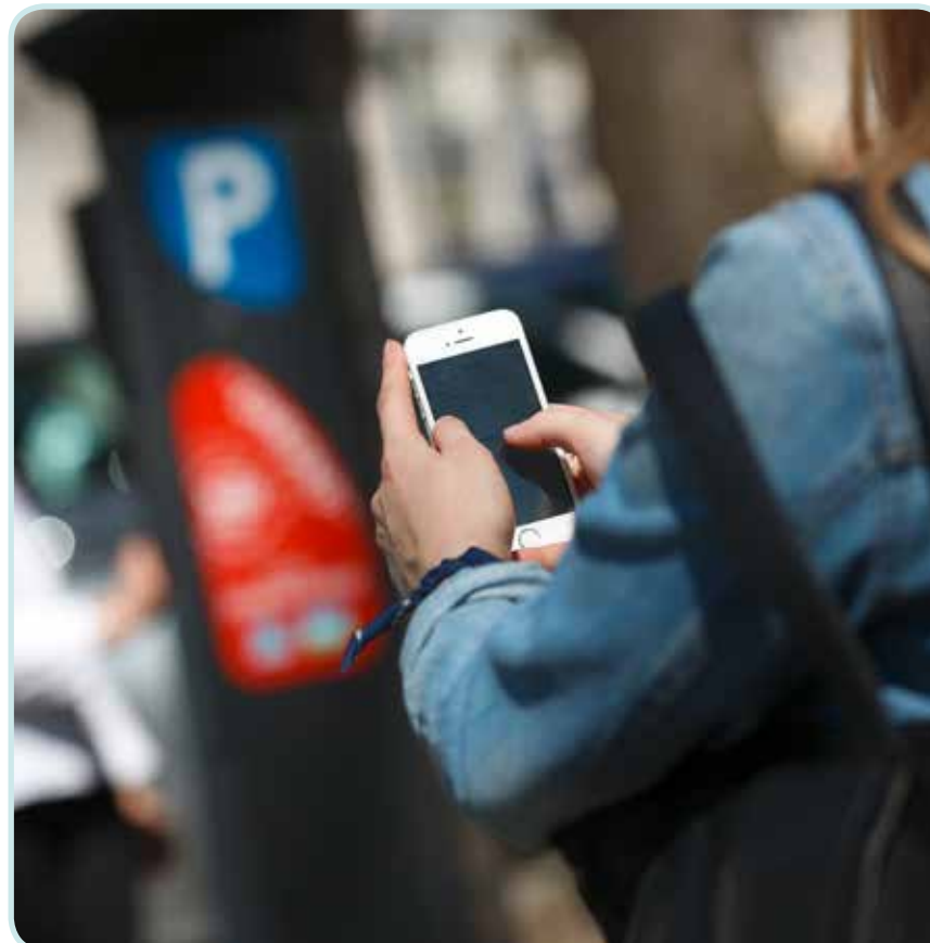
La transition énergétique ouvre de nouveaux marchés et permet la création d'emplois dans des secteurs innovants comme par exemple les mobilités durables